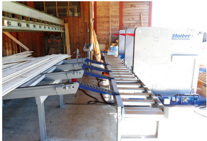
Zuförderstrecke in Richtung der Stoiber-Stapelanlage mit Ausschussklappe für einen einfachen Arbeitsablauf

Die Einzelbrettstapelanlage StoStack 5000 mit integrierter Zuföhrereinrichtung ermöglicht die flexible und effiziente Stapelung von Sägebrettern, Pfosten und Lattenbündeln. Die hochmoderne Maschine erfüllt dabei alle Anforderungen: Ob das bündige Stapeln von Brettern unterschiedlicher Breite, die Stapelung mit oder ohne Luftspalt, eine exakte Längenausrichtung jeder Lage oder das flexible Aussortieren beschädigter Bretter – die Anlage erledigt alle Aufgaben effizient und zuverlässig.