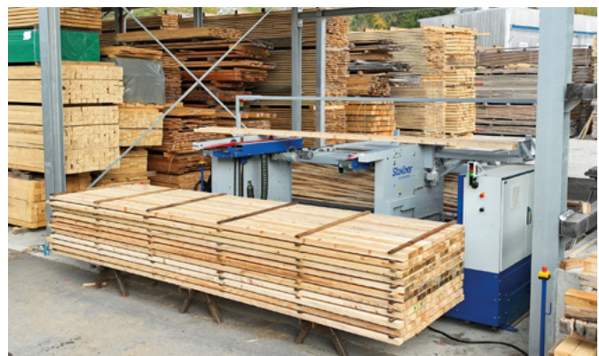
Perfekte, bündige Stapelung auch bei fallenden Breiten

Im 1. Quartal 2025 wird wieder eine Vorföhranlage zur Verfügung stehen. Nutzen Sie die Chance und testen Sie die StoStack 5000 für zwei Wochen unverbindlich in Ihrem Unternehmen. Das Team der Firma Stoiber freut sich über Ihre Terminanfrage.